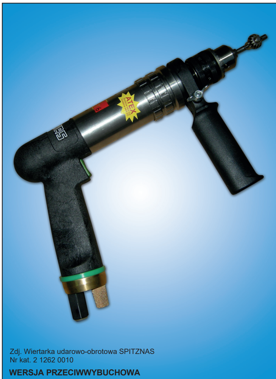
Zdj. Wiertarka udarowo-obrotowa SPITZNAS Nr kat. 2 1262 0010