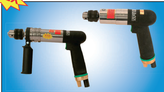
Zdj. Wiertarka pneumatyczna 2 1262 0010 / 2 1266 0010

* Możliwość włączenia i wyłączenia mechanizmu udarowego