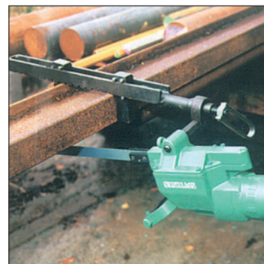
Uchwyt do cięcia kształtowników