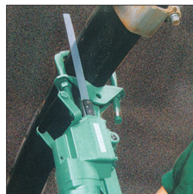
Uchwyt do cięcia obudowy V