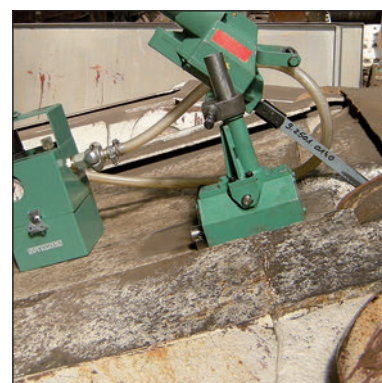
Uchwyt magnetyczny do cięcia sworzni obudowy zmechanizowanej